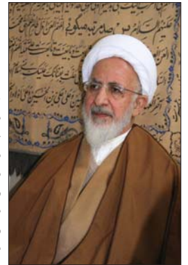
شعله‌ور شود. / ۲۳۸

حکیم متاله حضرت آیه‌الله جوادی املی روز پنجشنبه ۲۹ مرداد در دیدار دانشجویان عضو اتحادیه جامعه اسلامی دانشجویان در شهرستان دماوند، با بیان این‌که باید در رفتار، گفتار و اعمال خود مراقب باشیم آتش اختلاف را روشن نکنیم، تصریح کردند: مبدا حرفی برزین و کاری انجام دهیم که آتش اختلاف