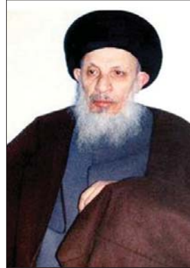
نگرانی کردند. / ۲۳۸

حضرت آیه‌الله سید محمد سعید حکیم، از مراجع تقلید مقیم نجف اشرف، طی پیامی به پانزدهمین همایش ملی مبلغین ماه مبارک رمضان در نجف، از کشتار جمعی شیعیان شمال عراق توسط تروریست‌ها به شدت ابراز