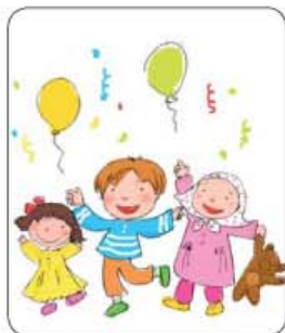
صفحات ۴ و ۵